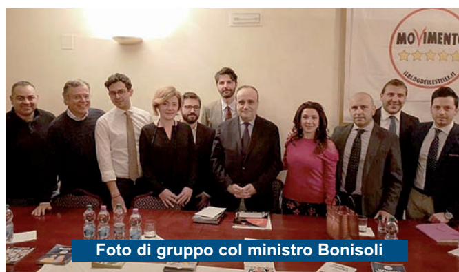
Foto di gruppo col ministro Bonisoli

Il ministro nel capoluogo molisano per incontrare portavoce, attivisti e simpatizzanti del Movimento 5 Stelle Molise. Durante l'incontro informale si è parlato del sistema cultura del Paese, della valorizzazione dei nostri tesori, del riconoscimento delle professionalità e dei temi culturali che stanno a cuore al M5S a livello locale e nazionale. Ma si è parlato soprattutto delle condizioni di salute del patrimonio culturale molisano, di quanto si sta facendo e quanto si deve ancora fare per aumentare i flussi di visitatori nei tanti siti culturali d'Italia e del Molise. Prima di arrivare, il ministro ha fatto un veloce sopralluogo al museo venafano del Verlasce promettendo una visita tecnica nelle prossime settimane in tutta la regione. L'incontro di ieri, infatti, è servito a gettare le ba-